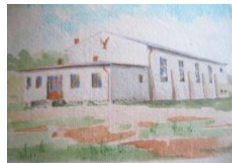
Foto: Původní budova sokolovny z 20. let minulého století