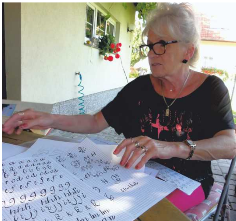
Kronikář by měl umět psát krasopisně, k učení slouží kaligrafické předlohy.