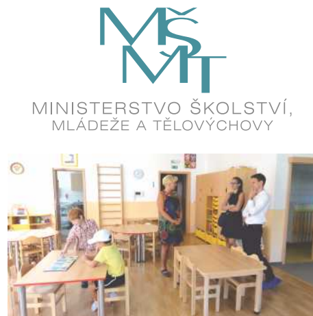
MINISTERSTVO ŠKOLSTVÍ, MLÁDEŽE A TĚLOVÝCHOVY

Další dotace, tentokrát se Středočeského Fondu rozvoje obcí a měst, směřovala do objektu Kulturního a komunitního centra v Příčné 61, kde se díky ní podařilo vyřešit vleklý problém s vytápěním. Dotace byla určena na instalaci nového plynového topení