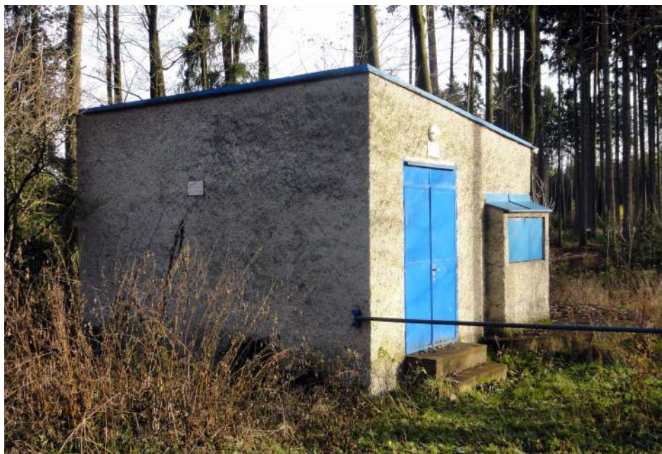
Vodárna – užitková voda pro Zájezdů

Je pravda, že stávající vodovod v obci Žernovka zatím plní svou funkci a obci se jeví daří s určitým úsilím provozovat, přestože je veden pouze jako užitkový a nevztahují