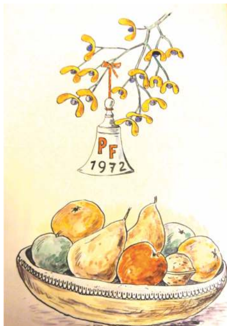
Zpracoval a zapsal v roce 1975 František Sýkora, kronikář

Kdysi, jako léčivá rostlina, bylo užíváno proti padoucnici, dále na stromy byly zavěšovány keříčky jmelí k zapuzení housenek a z jeho bobulí byl vyráběn lep na ptáky. Jmelí tedy bylo i bylinou užitečnou, nám je však dnes především symbolem nejkrásnějších svátků v roce.