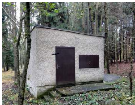
Vodárna – užitková voda pro Horku

Veřejná schůze, kde byli o této skutečnosti občané informováni, proběhla v září a je pro nás nemilým překvapením, že začátkem listopadu evidujeme pouze cca 40 dodaných dokladů, tedy pouhou čtvrtinu!!! Znamená to, že dotace obci Mukařov