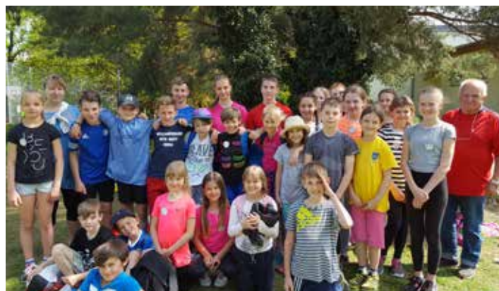
Děti předvedly skvělé výkony na plaveckých závodech.