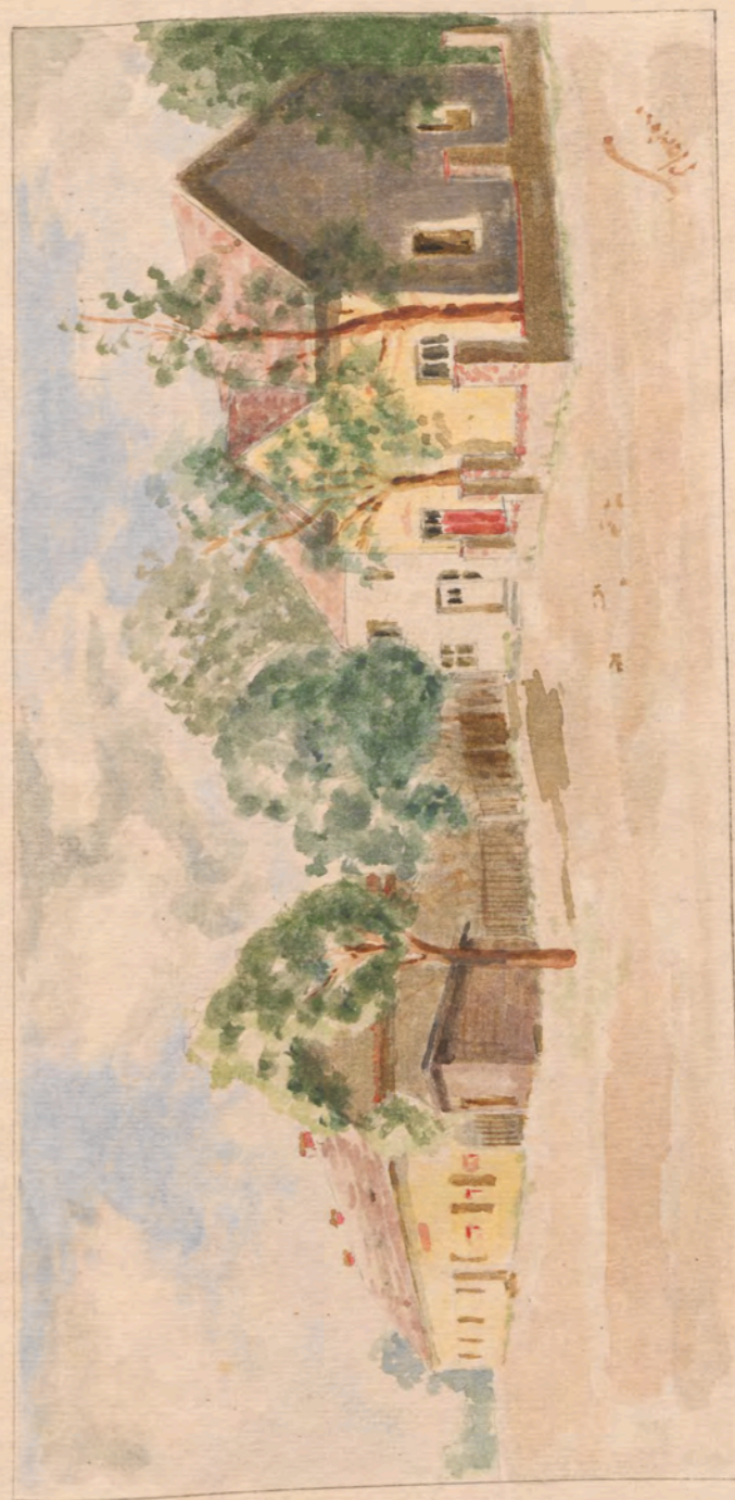
Část bývalá Kovárny a kolárny