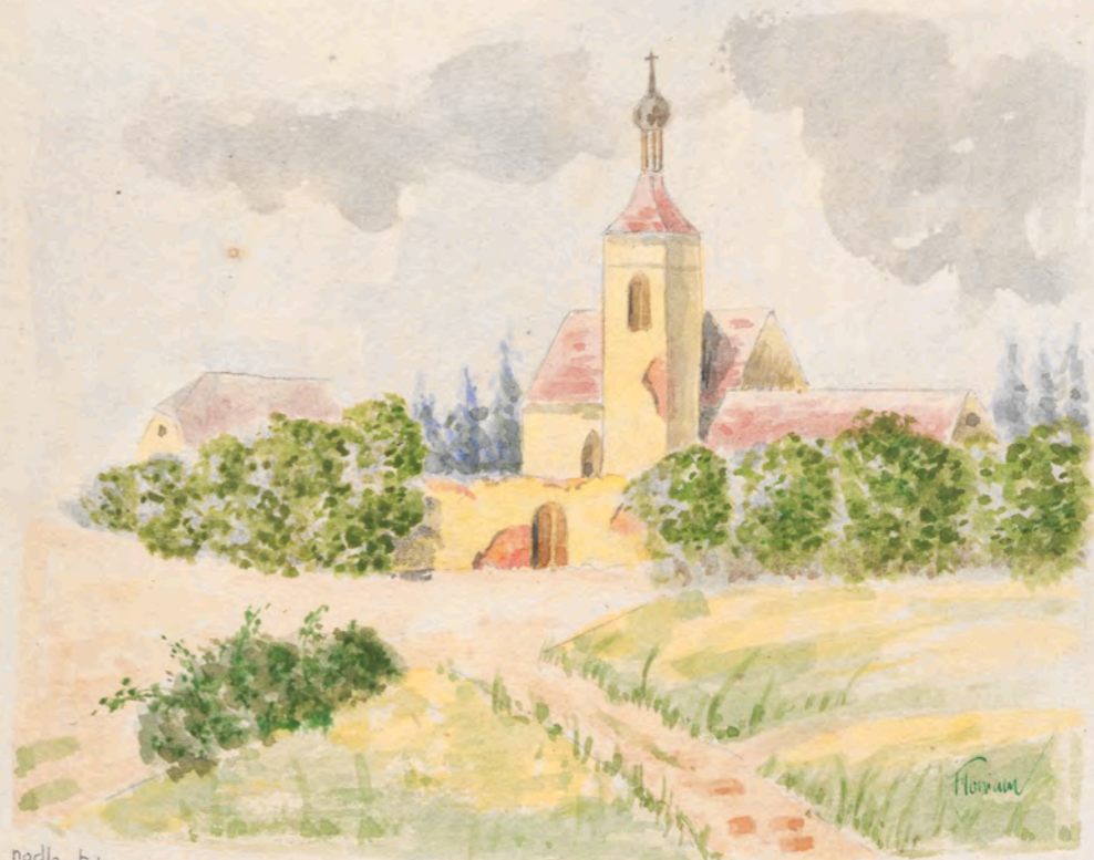
podle fotografie originálu v majetku faráře mukařovského I. Šury jeho půdorys