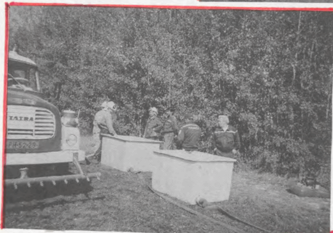
SDH Žemouka u domu na disciplině s cyklocom při Mukaršovské soutěži "La tui voly" 2003