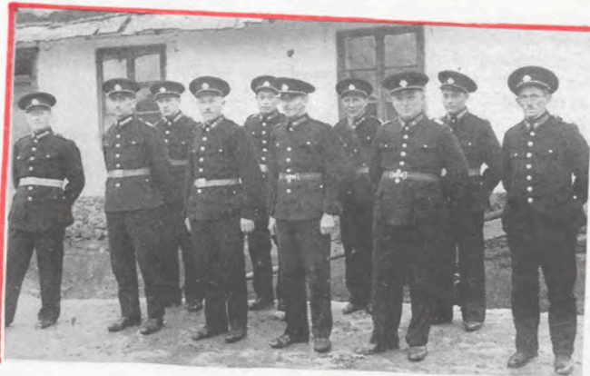
Poslední členi SDH Žemouka okolo roku 1947