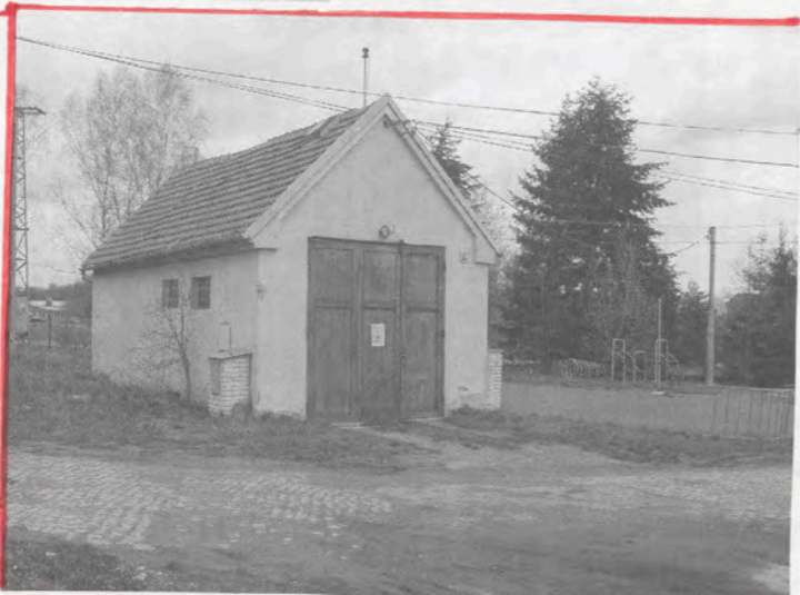
Hranička kluzoviště po převrh' v roce 2003