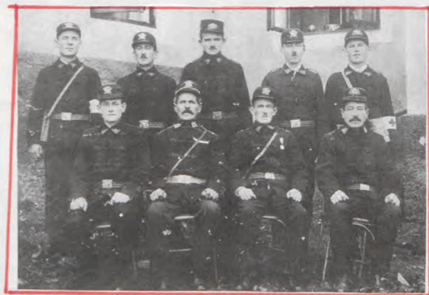
První členové SDH Železná 1914

SDH postupně dostrojuje své technické prostředky, v roce 2003 nové kápsala vyjádou automobil CAS 24, který nahradila k CAS 23 a PPS 12. Nově členská schůz' byla zvoleni nové funkcionáři. Sloužícím byl učitel Karel Jip' slouž', jednatelem učil Jan, učitelem jednotky Běchota Robert, učitel Kugler Petr, pokladník učil Jip' a gauděmiste Měch Malje. SDH se kitem dvou let učitelem s učitelů v Těchovi, v Mukašovicích a Dolínku, kde se učilce dále uměsto. Páčilato velmi kockou slavnosti, dětský den, havi-ský ples, sbor učitelů železničeských a jiné společenské abce v saucasné době evaduje SDH železničeská 42 členů, což je na dlouhou léta slušný učitelům d'opřekem.