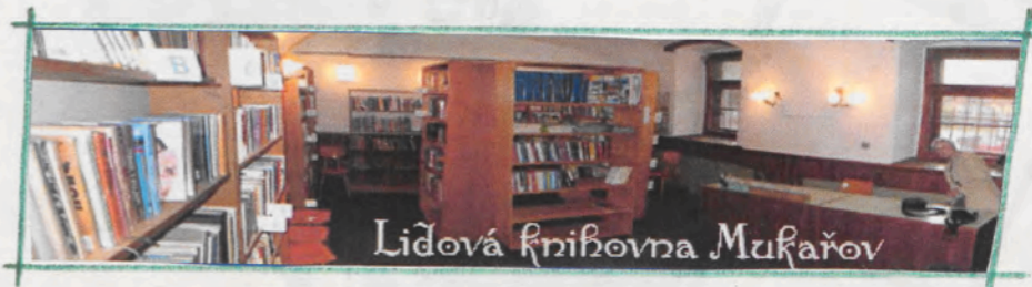
Lidová knihovna Mukařov