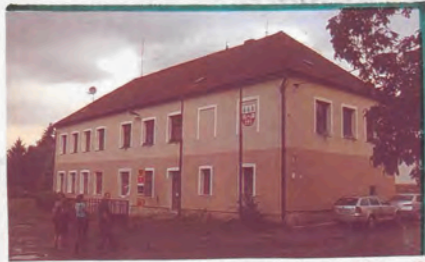
OPRAVENÁ BUDOVA OÚ