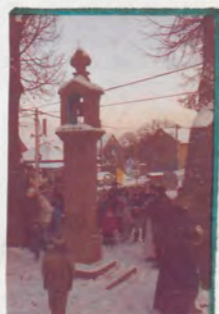
KAPLIČKA V SRBINĚ