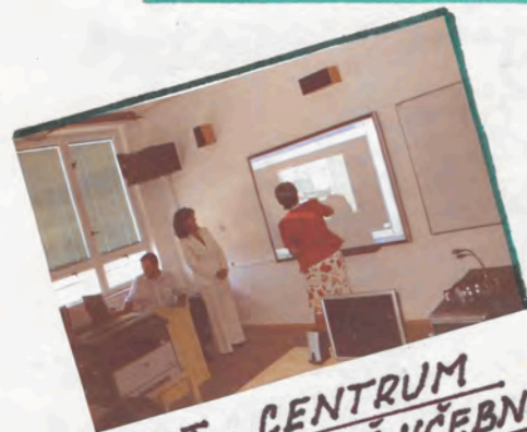
IKT - CENTRUM POČÍTAČOVĚ UČEBNY