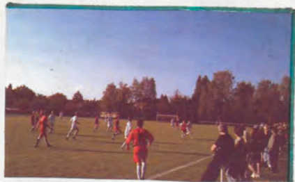
ŮPRAVA HRISTE TJ