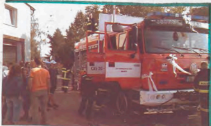
NOVÁ TATRA 815 HASIČŮM