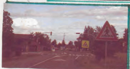
PŘECHOD SE SEMAFOREM