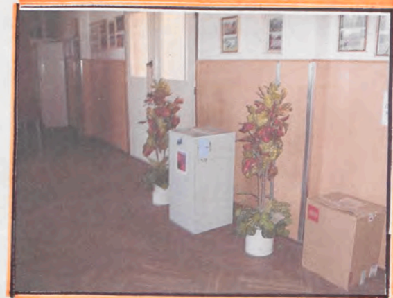
VOLEBY DO PARLAMENTU ČR