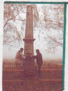
POMNÍK PADLÝM v 1. SVĚT.