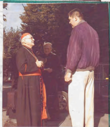
NÁVŠTĚVA KARDINÁLA MILOSLAVA VLKA