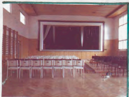
OPRAVA SÁLŮ SOKOLOVNY