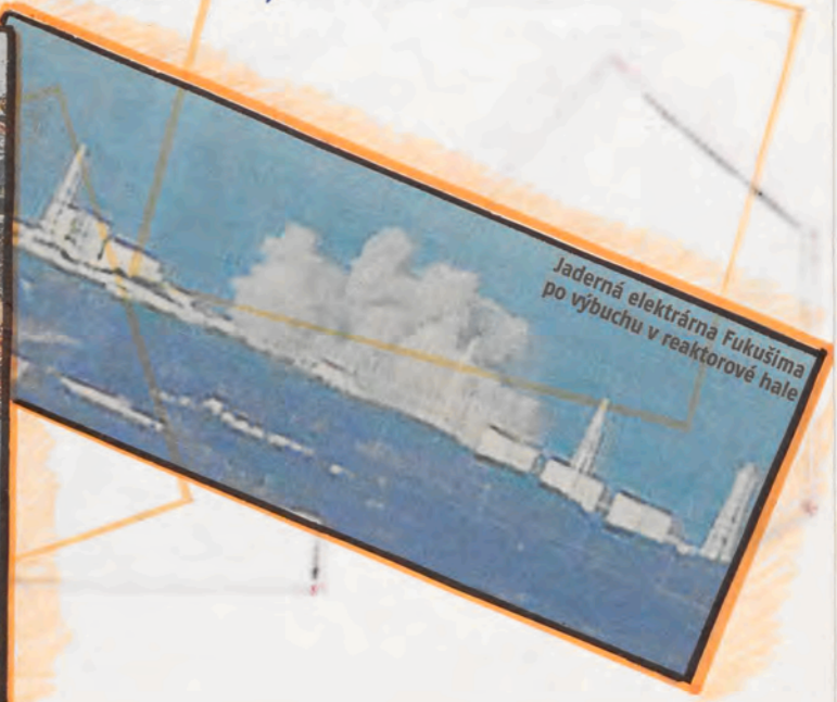
Jaderná elektrárna Fukushima po výbuchu v reaktorové hale