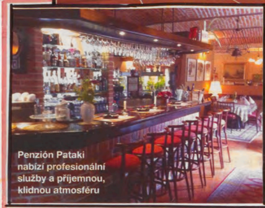
Penzióň Pataki nabízí profesionální služby a příjemnou, klidnou atmosféru