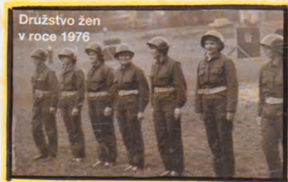
Družstvo žen v roce 1976