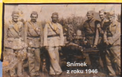
Snímek z roku 1946