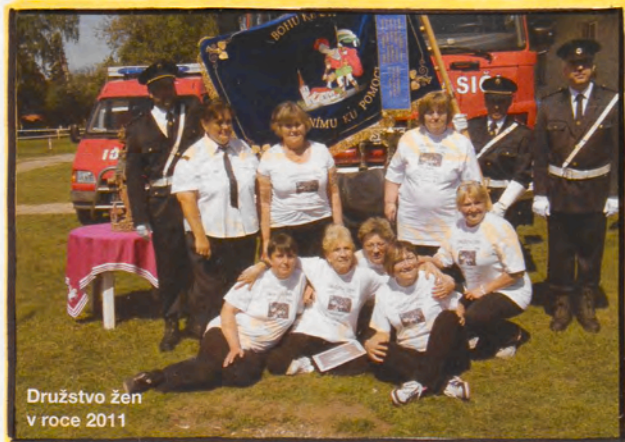
Družstvo žen v roce 2011

Na radu slavnostní ualné komady byli všichni účastníci posudni na pohostitím Ukř-kodnych 80 let činnosti by nebylo mnohonásobně bez nadšim a podpory členů skou. V první desetiletí 21. století však patří SDH Mukařov k úspěšným skou v České republice.