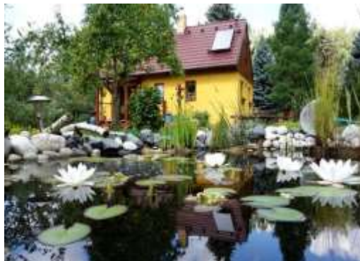
Můj současný domov